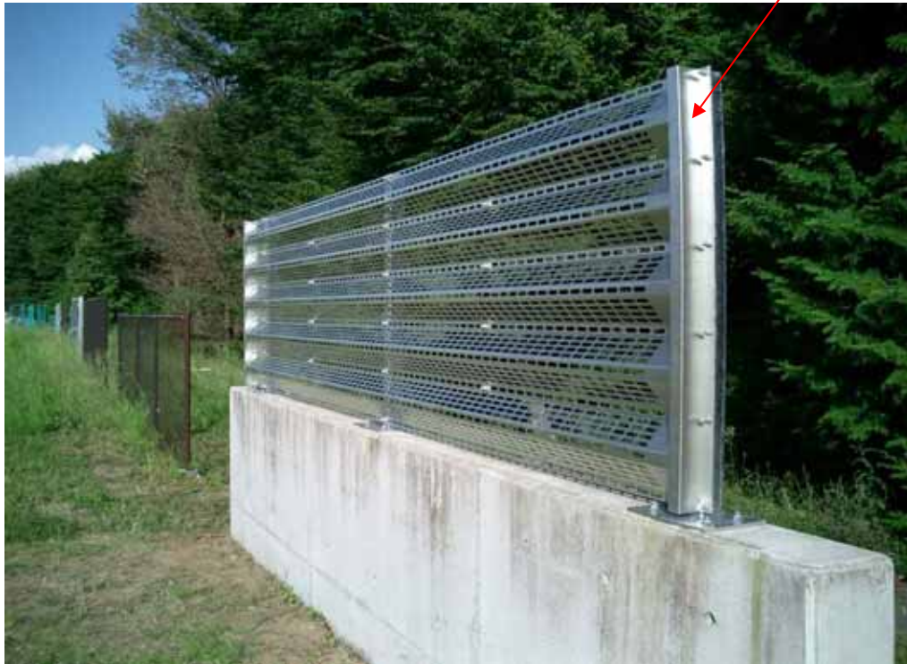
端末柱の端部処理

パネルは、走行方向に長孔を空けていますので、透過性は良好です 支柱ピッチは、2mと3mのタイプがあり、端尺対応も可能です 2mピッチタイプは、従来の落下物防止柵G1タイプと、アンカーボルトのサイズ、ピッチが同じなので 既設のアンカーボルトが使える、更新が出来ます 支柱は、壁高欄に対し直角に建てます