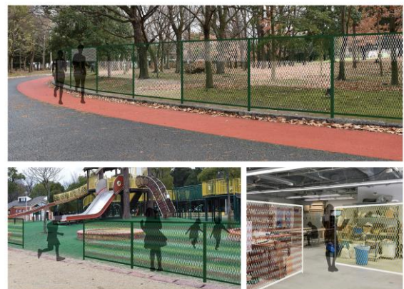
【フレーム、金網の色彩のカスタマイズ】