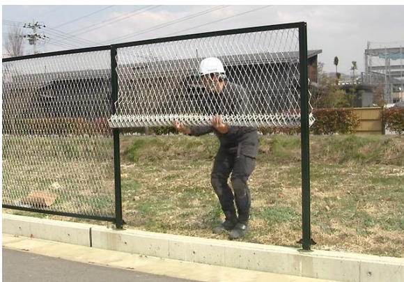
【胴縁とユニット化した金網の取付】

これらの特長により、「ニットフェンス」は、学校、幼稚園、公園、住宅など人が集う場所に最適なフェンスです。